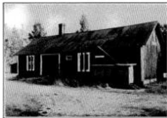
Billackeringsverkstaden som revs 1991.

En för länge sedan riven byggnad är också danspaviljongen som låg i skogen norr om byn. För mig som kom från ett frikyrkligt hem var detta syndens näste, där det gick hett och våldsamt till med fylla och slagsmål. Dansbanor fanns då på flera ställen i socknen. Byarnas ungdomar ordnade själva sitt nöjesliv. »Det var dans bort i vägen på lördagsnatten...» som Fröding skaldade.