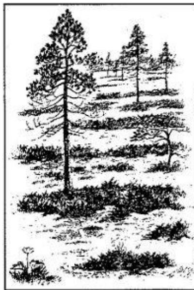
Mur eller Myr? Teckning: Jonas Lundin

I äldre tid hade myrarna ekonomisk betydelse på ett sätt, som de inte har idag. Myrarna användes för slätter, och myrhöet kunde vara viktigt för att klara kreaturen över vintern. Kan det vara så, att mur och myr ursprungligen haft olika innebörd med hänsyn till värdet som slättermark?