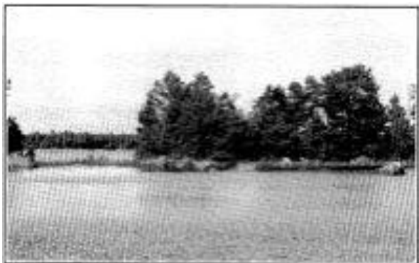
Gräsharen vid Hillevik

Bebyggelsenamn, som innehåller ordet har , tycks inte förekomma i lille. I Hamrånge socken däremot finns Hari , som är belagt tidigast 1556 (Hedblom, Gästriklands äldre bebyggelsenamn, Uppsala 1958, s. 144) och ursprungligen var ett torp men nu är ett utbyggt område. I Valbo socken finns Harnäs , belagt 1555 (Hedblom s. 159).