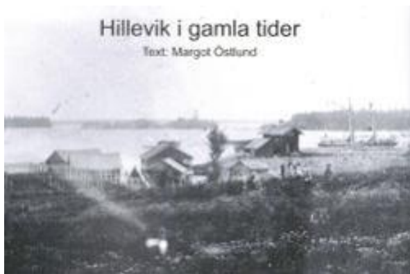
Hamnen i Hillevik