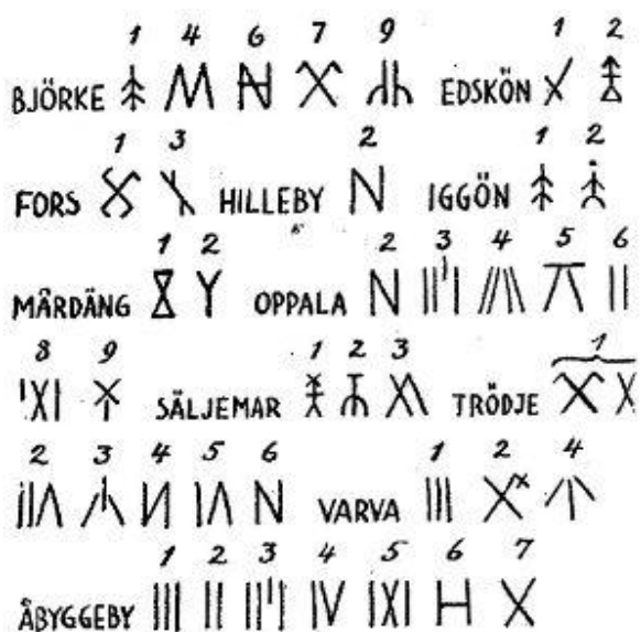
Ett antal bomärken från "sub"-hemmanen i Hille omkring 1825