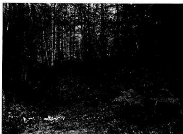
Den gamla kärrvägen mellan Bostigen och Skarvsjötorpet.

Boskapen togs som regel in i oktober. Eventuellt så bytte man tjänstefolk igen. Säden tröskades under hösten. I november påbörjades kolningsarbetena igen. Nya kolmilor restes. När vintern kom på allvar så drog man not i sjöarna. Ofta var man många till hjälp.